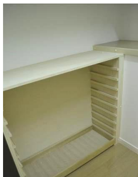
↑桐タンスの引出しだけを再利用。 たくさんの着物を収納します。