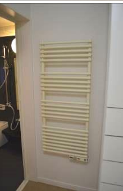
↑タオルウォーマー ピース TSNタイプ