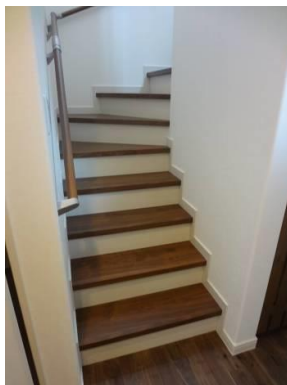
9. ご主人のお得意様から、特注家具のプレゼント。