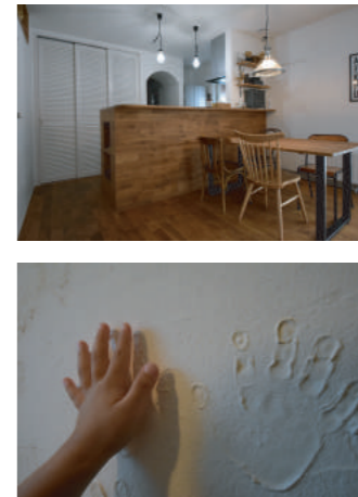
完成時の家族の手形と2年経った今の手を比べると大きくなりました。