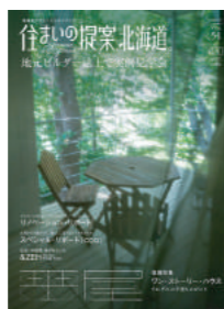
住まいの提案、北海道。vol51