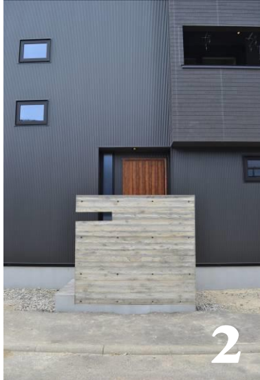
2.アプローチの コンクリート塀は、 杉板型枠仕上げ素材感を演出。