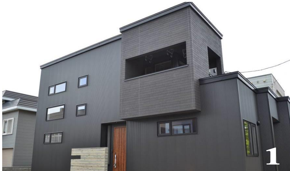
1.個性的なシャープな印象 ブラックを基調にまとめた外観。