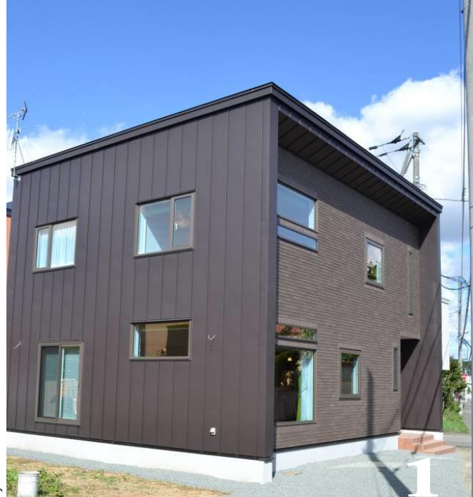
1. 打合せを重ねた窓のレイアウト、タイル施工により重厚感ある外観に。