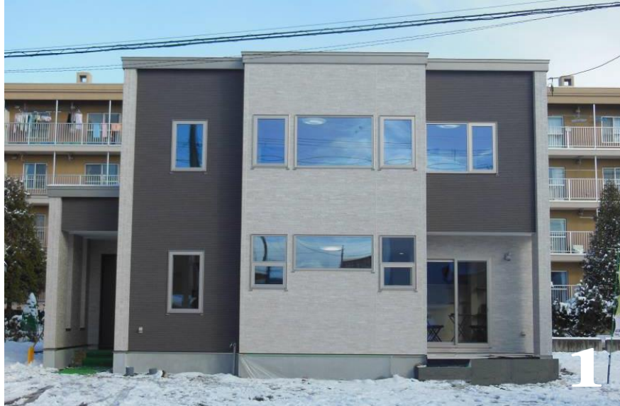
1.シンメトリーを追求した重厚感漂う外観。