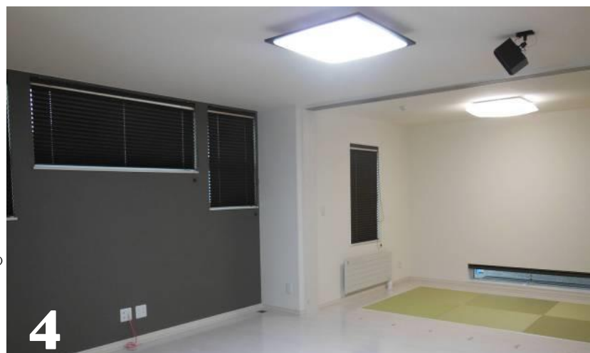
4.ダークカラーのクロスが空間の演出のひとつに。天井に施主支給のスピーカーを設置。