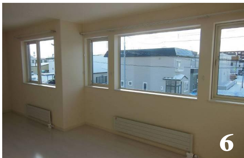
6.南側に配置した子供部屋。 将来仕切りが可能、収納も2箇所完備。 窓からはパノラマ景色が最高。