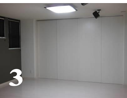
2・3.リビング横に家族が集まる洋和室 大開口の間仕切建具を採用し開放感たっぷり 建具で仕切っても圧迫感がありません。