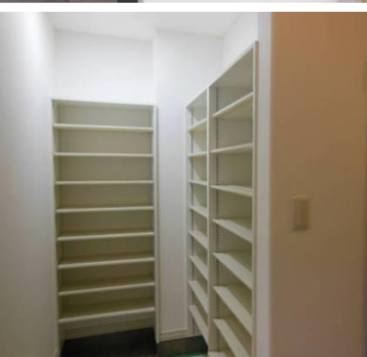
8.玄関奥には、シューズ クロック大人の靴で 約96足収納可能。