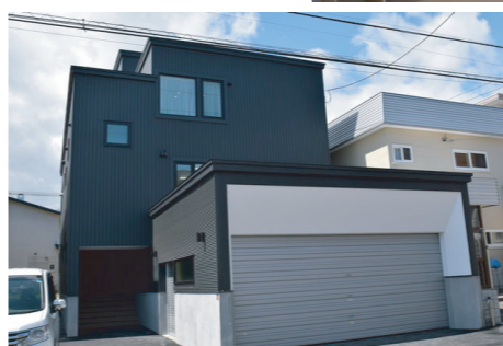
札幌 西区 A様邸